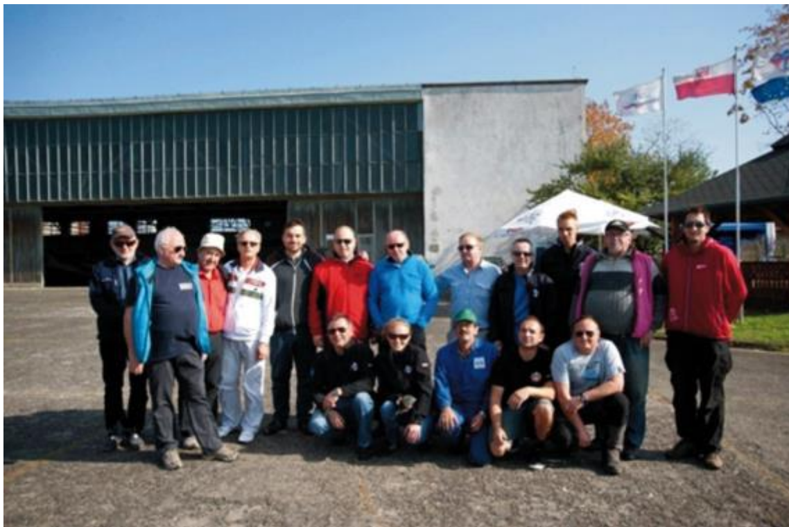
Wspólne zdjęcie po zawodach na celność lądowania w Krośnie 2014 rok,