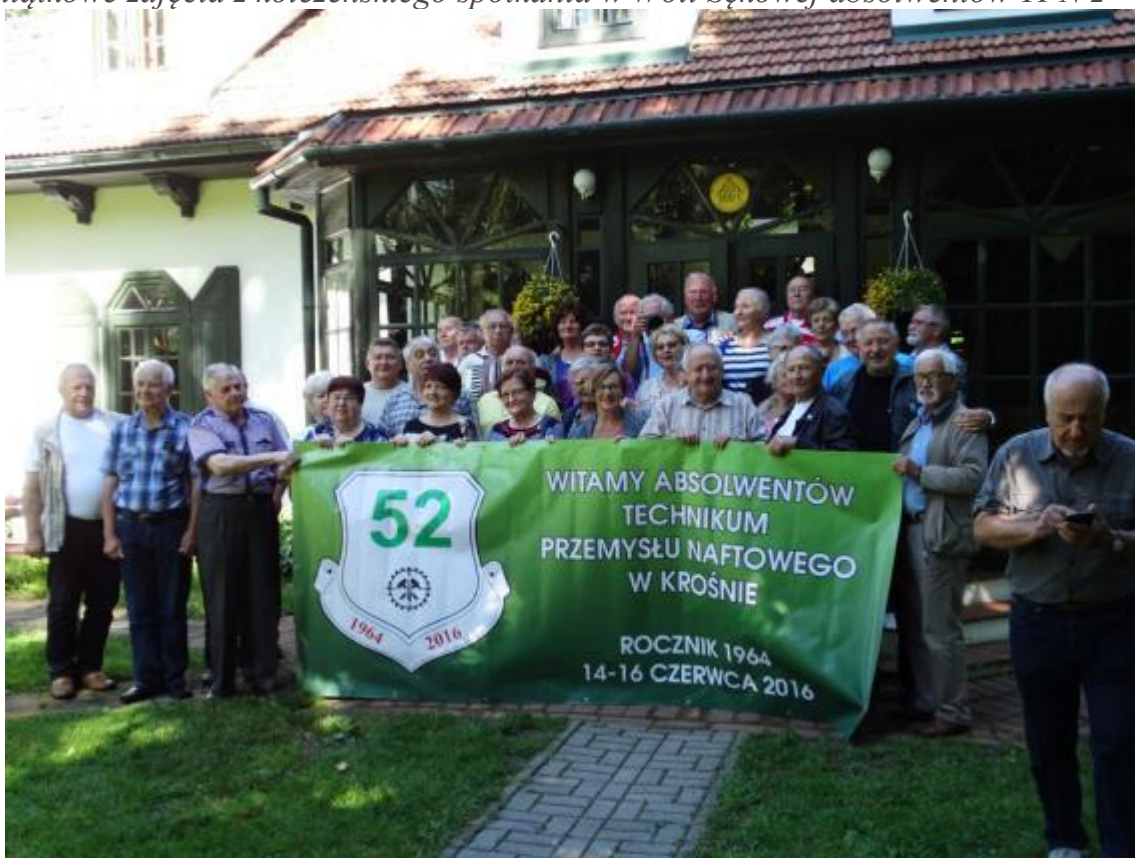
Pamiątkowe zdjęcia z koleżeńkiego spotkania w Woli Sękowej absolwentów TPN z